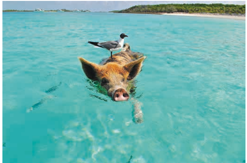
Valse herinnering of waargebeurd?

Dat idee past wonderwel bij degenen die ‘alternatieve feiten’ uitventen. Wat er achter zit, is een radicale vorm van waarheidsrelativering. Maar als het om het geheugen gaat, is dat toch een paar bruggen te ver. Dat geheugen van ons